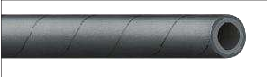
VAPORCORD® • AUFDRUCK: VAPORCORD® STEAMHOSE/DAMPFSCHLAUCH PN 7 BAR - MAX 164° C