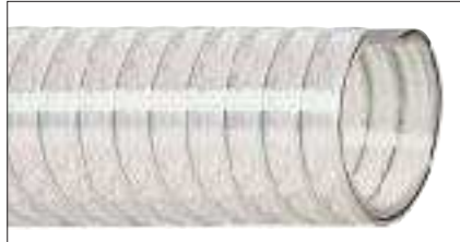
ARMOFLEX AUFDRUCK: ARMOFLEX - NON TOXIC