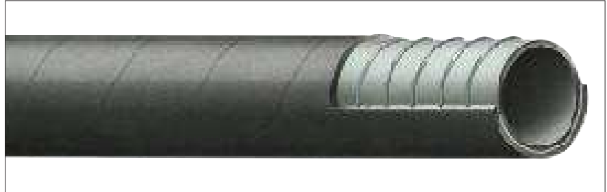
AUFDRUCK: HEDUFLEX® S/D PN 10 BAR (203/254 PN 6 BAR)