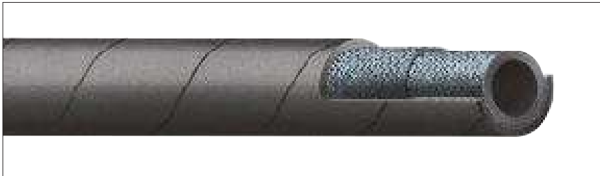
METALVAPOR® /DIN • AUFDRUCK: METALVAPOR® DIN 2825 - STEAM - 18 BAR - EPDM DURCHMESSER - M - MONAT/JAHR