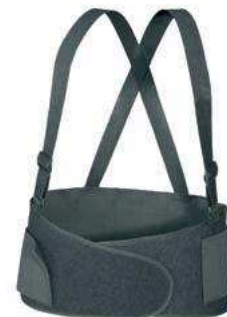
Art.-Nr. BR 108

Größen: M 78–102 cm, L 82–105 cm XL 98–128 cm, XXL 109–137 cm Erhältlich in schwarz. Andere Farben auf Anfrage.