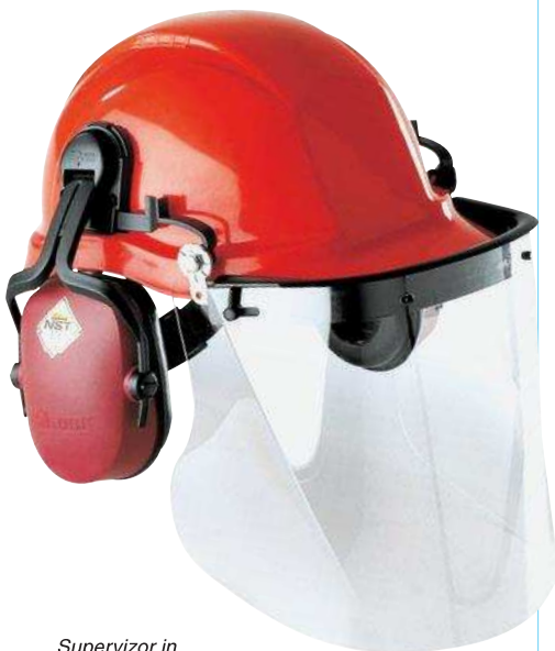
Supervisor in Verbindung mit einem Industrieschutzhelm