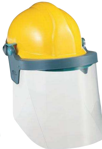
Supervisor mit AC-Scheibe klar und Kunststoffhalter SA660