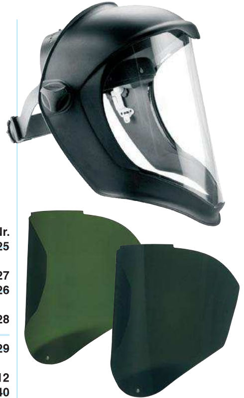
Bionic Ersatzscheiben Welding IR3 und IR5