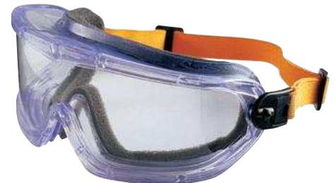
V-Maxx klar mit Dichtrand