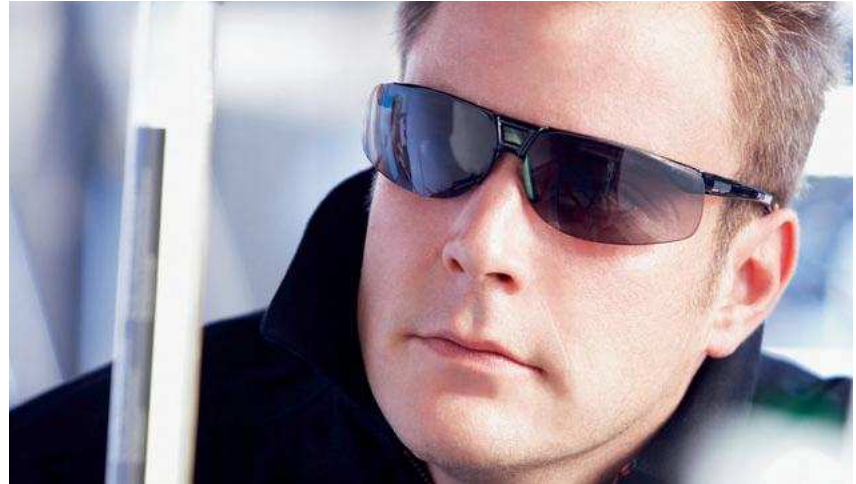
Bügelbrille Protégé – Sie werden sie nicht mehr absetzen wollen