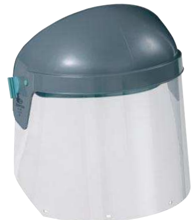
Supervisor mit PC-Scheibe klar und Kopfhalter SB600